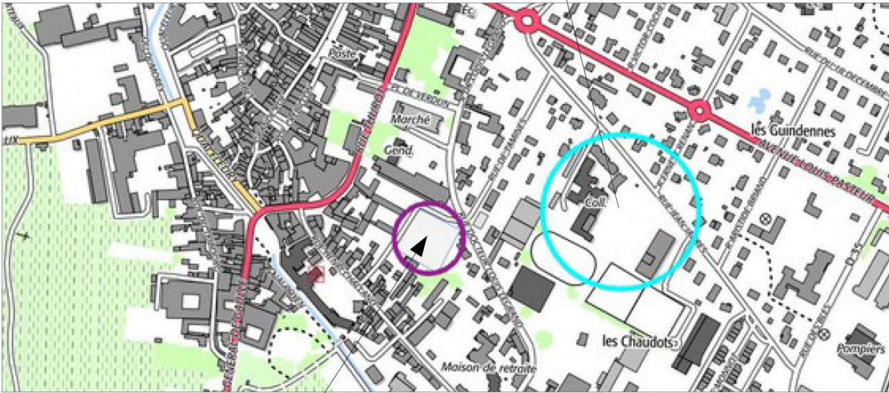
Parking Saint Vincent