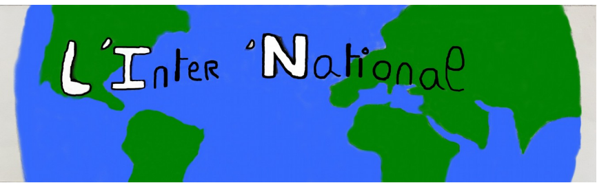
19/03/2019 4e4 1,80€ Nuits Saint Georges - Collège Félix Tisserand/Mme Dupouy

POLITIQUE EUROPÉENNE L'union en danger Le 18 mars 2019, le gouvernement britannique a tenté, avec difficulté, de rallier les députés eurosceptiques à l'accord du Brexit de la première ministre Theresa May. Soucieuse, cette dernière a encore une fois prévenue qu'en cas de troisième échec du parlement, le Royaume-Unis pourrait ne pas quitter l'UE. P.3